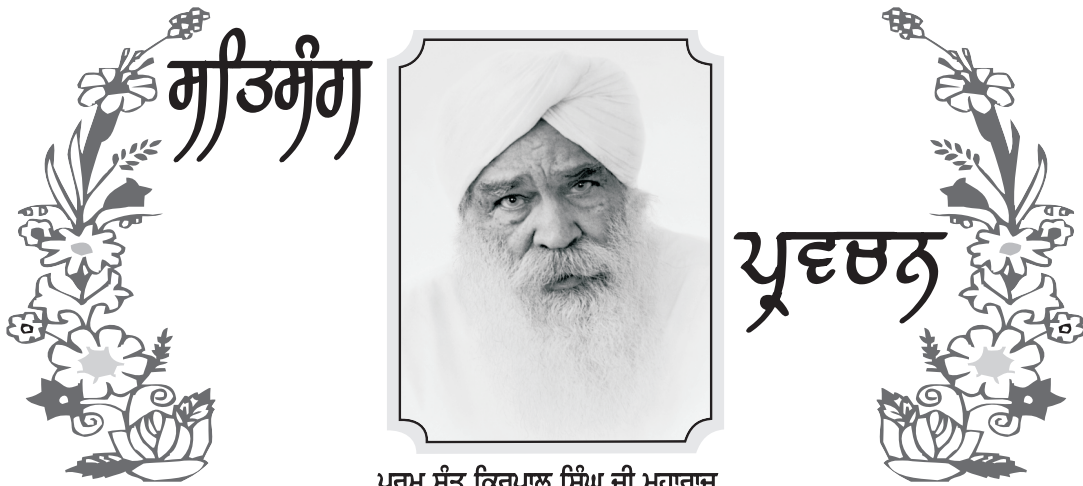
ਪਰਮ ਸੰਤ ਕਿਰਪਾਲ ਸਿੰਘ ਜੀ ਮਹਾਰਾਜ ਸਭਾ-38

ਦਿਲ ਨਾਲ ਦਿਲ ਦੀ ਗੱਲ ਸਮਾਂ 3 ਦਸੰਬਰ, 1970, ਸ਼ਾਮ